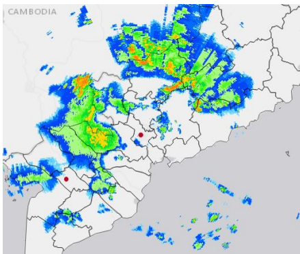
Ảnh ra đa thời tiết