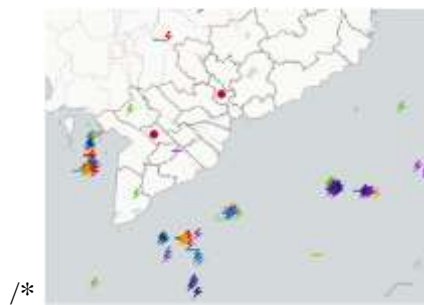
Ảnh định vị sét