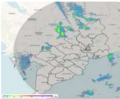
Ảnh radar thời tiết