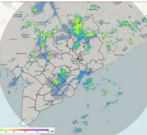
Ảnh radar thời tiết