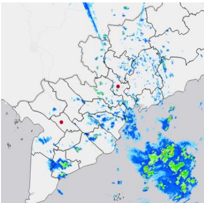
Ảnh radar thời tiết