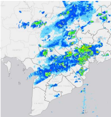
Ảnh radar thời tiết