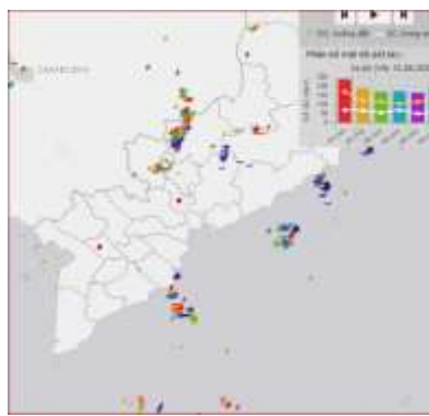
Ảnh định vị sét