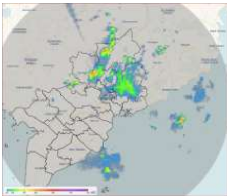
Ảnh radar thời tiết