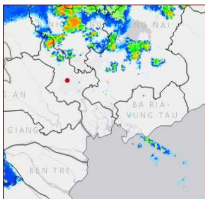
Ảnh radar thời tiết