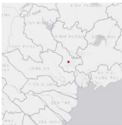
Ảnh định vị sét