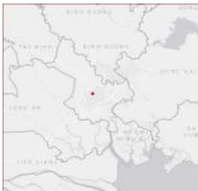
Ảnh định vị sét