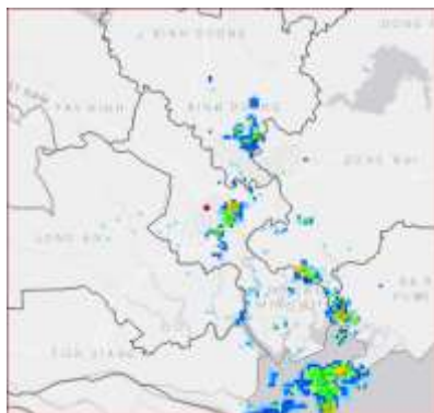
Ảnh radar thời tiết