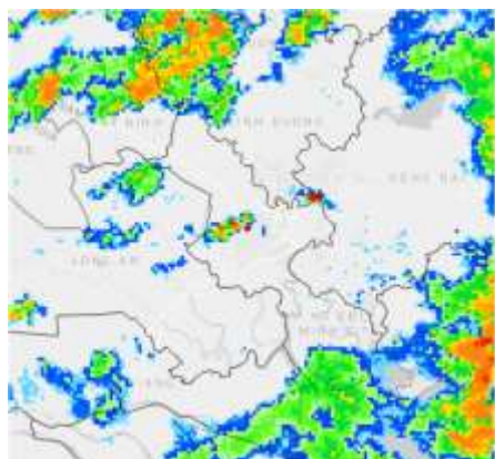
Ảnh radar thời tiết