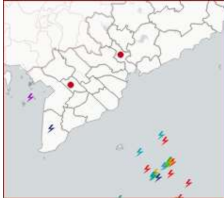
Ảnh định vị sét