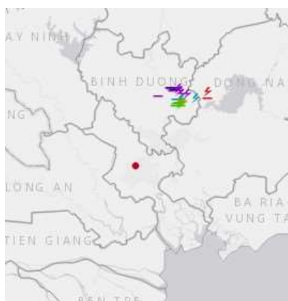
Ảnh định vị sét