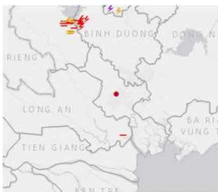
Ảnh định vị sét