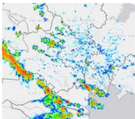
Ảnh radar thời tiết