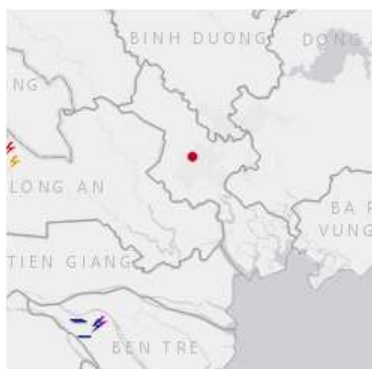
Ảnh định vị sét