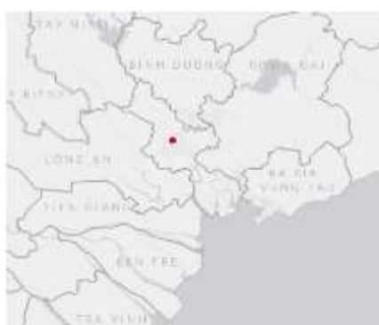
Ảnh định vị sét