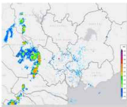
Ảnh radar thời tiết