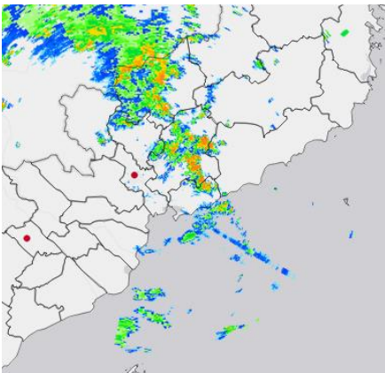
Ảnh radar thời tiết