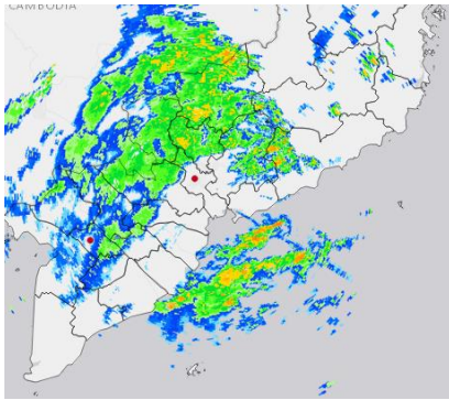
Ảnh radar thời tiết