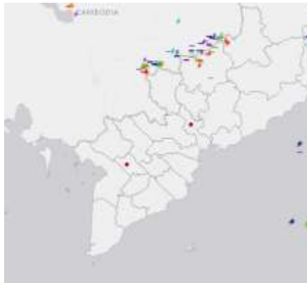
Ảnh định vị sét