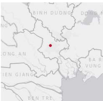
Ảnh định vị sét