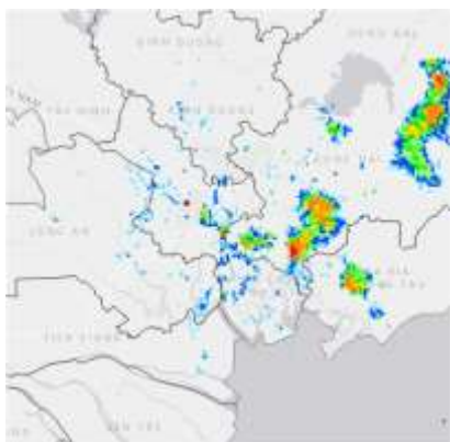
Ảnh radar thời tiết