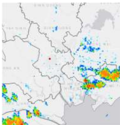
Ảnh radar thời tiết