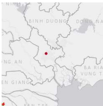
Ảnh định vị sét