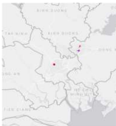
Ảnh định vị sét