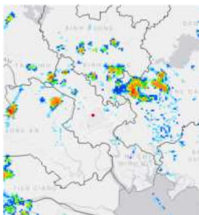
Ảnh radar thời tiết