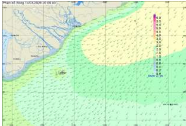
Hình 2: Bản đồ sóng dự báo lúc 20h00 ngày 14/03